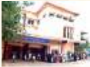
Charitable Hospital, Kottakkal