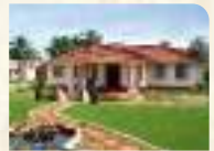
Centre for Medicinal Plants and Research