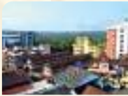
Hospital Complex, Kottakkal