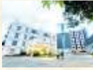
Hospital, Kottakkal East