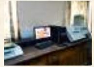
R & D Department