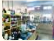
Quality Assurance Department