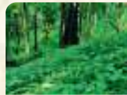
Herbal Garden, Kanjirapuzha